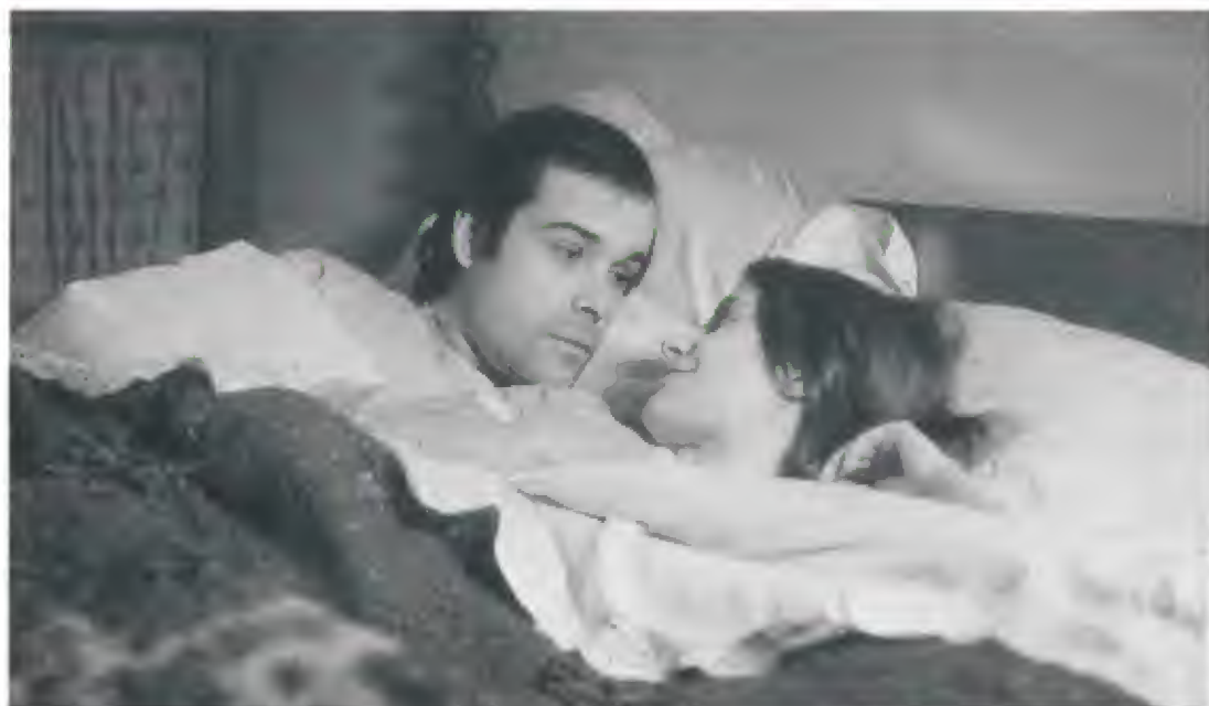
Antonio Resines - Asumpta Serna